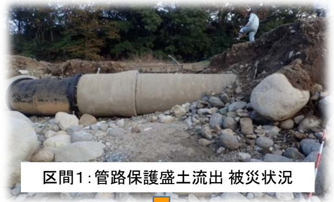
区間1: 管路保護盛土流出 被災状況