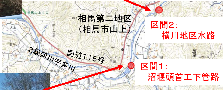
区間2: 横川地区水路