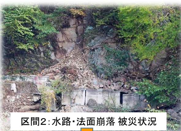
区間2: 水路・法面崩落 被災状況