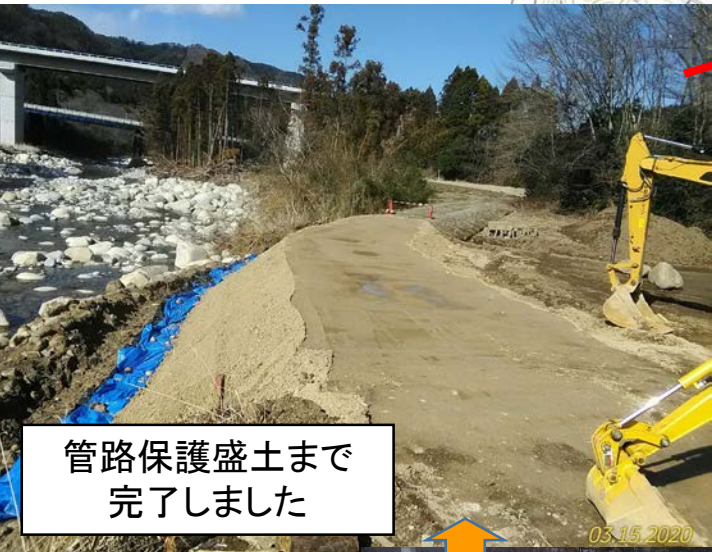
管路保護盛土まで 完了しました