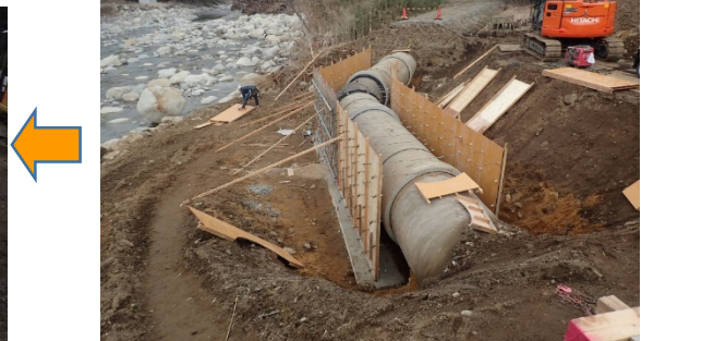
コンクリート巻立て完了