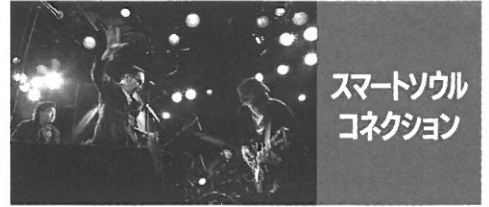
スマートソウル コネクション