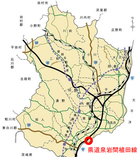
一県道泉岩間植田線の位置一

工事は、来年度完了予定とのことですが、使いやすい道路の一刻も早い完成を望んでいます。