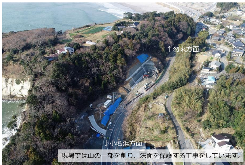
現場では山の一部を削り、法面を保護する工事を行っています。