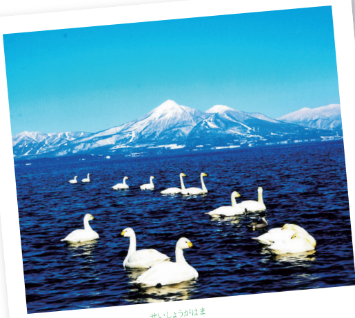
郡山市 湖南町 青松浜 せいしようがはま