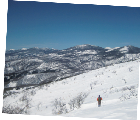
福島市・猪苗代町 箕輪山