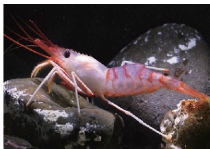
イベントで試食した 「シラユキモトゲエビ」

お寿司が食べられる水族館としても有名ないわき市のアクアマリンふくしま。説明パネルの中には、生き物の味や食べ方を紹介しているものがあります。パネルを作った担当者にお話を伺いました!