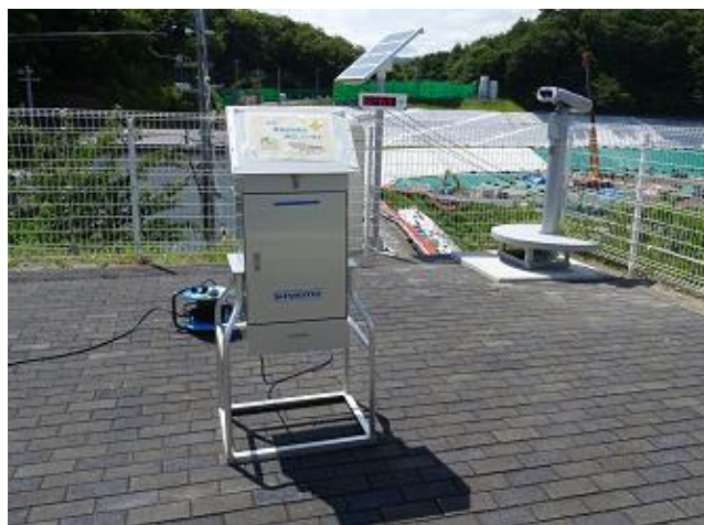
大気浮遊じん中の放射性物質の測定