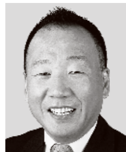
おしま くすお 大島 九州男 参議院議員 現職 平和憲法の精神を守ります