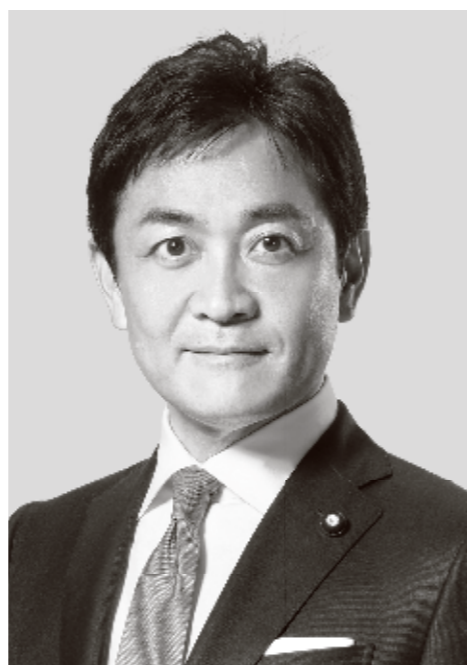
国民民主党 代表 玉木雄一郎