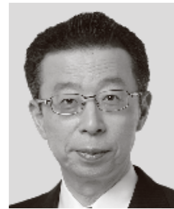
はまの よしふみ 浜野 よしふみ 参議院議員 現職 まっすぐに力強く!働く仲間のために!