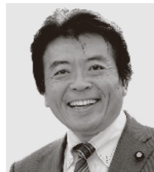
弁護士 仁比そうへい 現 55歳。参院議員2期。党参院国対副委員長。 活動地域 中国、四国、九州・沖縄