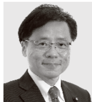
党参院幹事長・国対委員長 井上さとし 現 61歳。参院議員3期。 活動地域 東海、北陸信越、京都