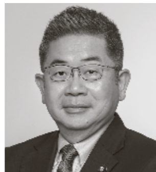
党書記局長 小池 晃 現 59歳。参院議員3期。全国革新懇代表世話人。医師。 活動地域 東京