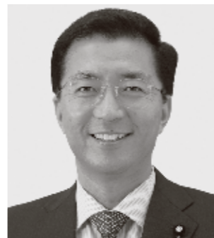
党副委員長 山下よしき 現 59歳。参院議員3期。 活動地域 大阪、兵庫、滋賀、奈良、和歌山