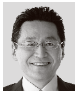
てつじ いそざき いそざき 哲史 参議院議員 現職 仲間の思い、かたちにしたい。