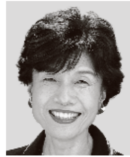
いの よりよ 円 より子 元参議院議員 元職 世直しおばあ、子育て世代全力応援