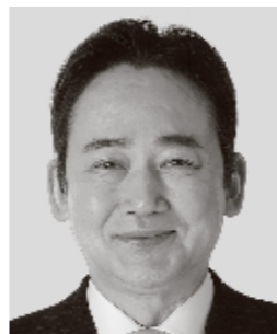
いしがみ としお 石上 としお 参議院議員 現職 全力で聴く。全力で届ける。 全力で挑む。