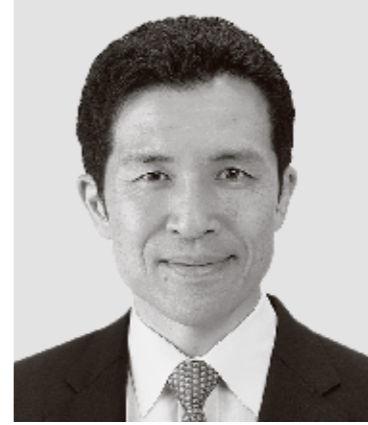
にい づま 新妻 ひでき 現

役職：元文部科学大臣政務官。 参院議員1期。 経歴：東京大学大学院修士課程修了。 年齢：48歳