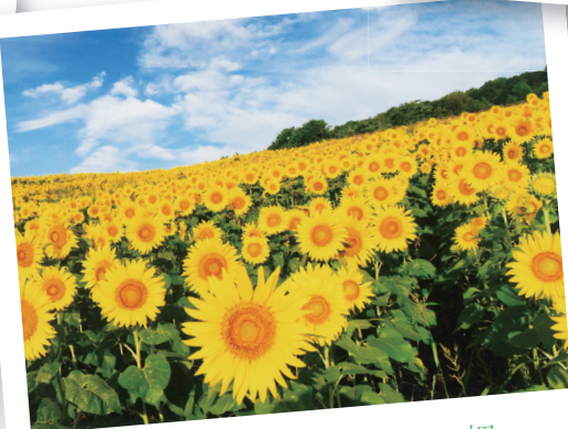
喜多方市 三ノ倉高原ひまわり畑