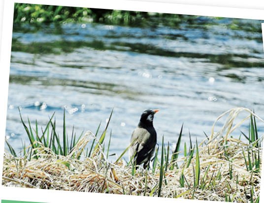
会津若松市 湯川の散策路 ムクドリ