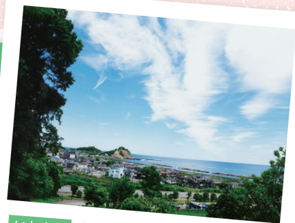
いわき市 久之浜町