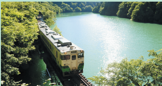
▲只見線と自然が織りなす美しい風景

只見線は生活、観光、教育、産業面でも多くの方々に活用され、何度でも乗りたくなる路線となることを目指しています。県では、地域の皆さんと協力して、地域資源を生かした企画列車や学習列車の運行、景観整備、二次交通の確保など、只見線の活用と会津地域の振興に取り組んでいます。