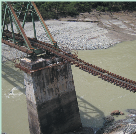
▲崩落した第5只見川橋梁