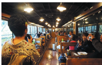
▲昨年の企画列車の様子

会津地域ならではの食や伝統文化の体験をセットにした企画列車を運行します。只見線に乗ってふくしまの魅力を体感しませんか?