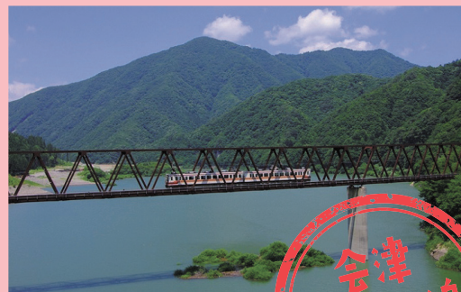
湯西川橋梁(栃木県日光市)

会津鬼怒川線は、福島県の会津高原尾瀬口駅から栃木県の新藤原駅を結んでいます。東武鉄道との相互乗り入れで、浅草〜会津高原尾瀬口間を約3〜3時間半で直結しています。沿線は温泉が豊富で、新緑や紅葉を楽しむことができます。