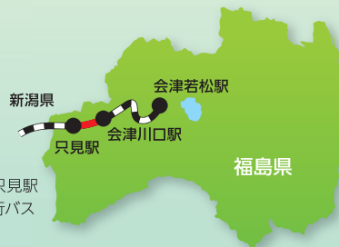
—会津川口駅～只見駅 不通区間のため代行バス 運行中