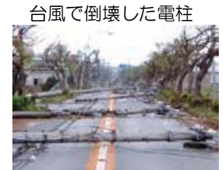
台風で倒壊した電柱