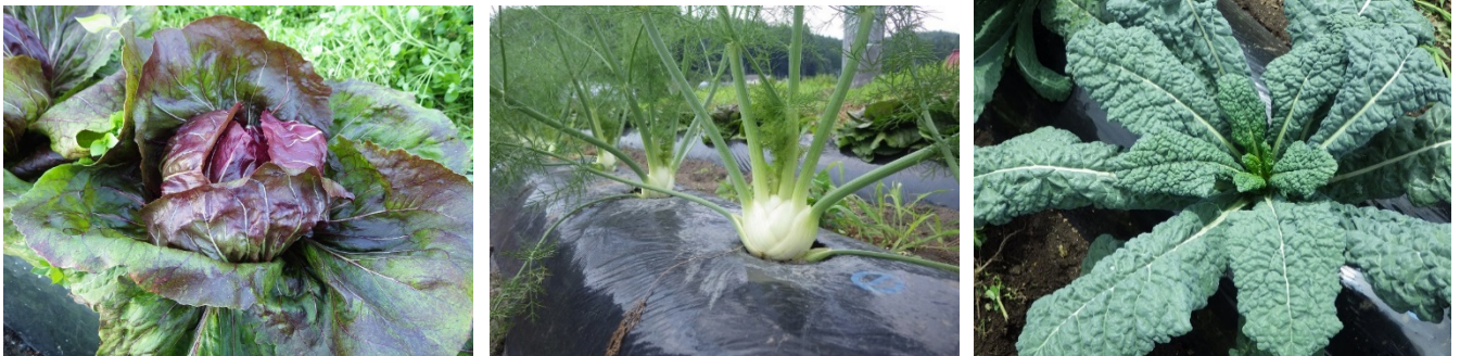
図2 収穫時期の西洋野菜(左:トレビス、中:フェンネル、右:カーボロ・ネロ(川内村))

注3) カーボロ・ネロは、サンサンネットソフライト(目合1mm)を、定植から収穫前まで、トンネル被覆とした。