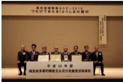
優良活動表彰を受賞された皆さん