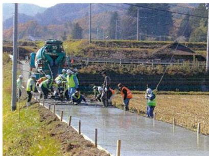
直営施工による農道舗装 (Eco中山農村環境保全会)

多面的機能支払交付金を活用した地域の優良な取組を広くPRし、県内全体の地域活動の活性化、地域コミュニティ機能の強化などに繋げていくことを目的として、毎年、優良活動組織を表彰しています。