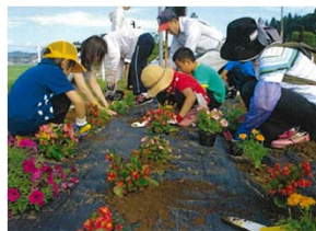
子供から高齢者まで参加した花いっぱい活動 (深渡戸ふるさと保全会)