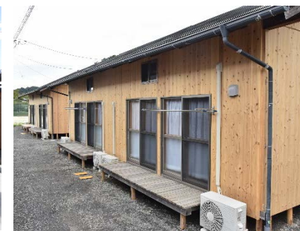
再利用事例2：岡山県総社市