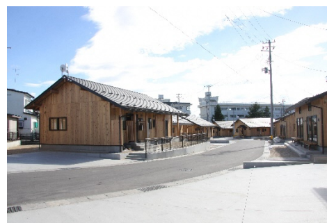
再利用事例1：復興公営住宅城北団地

応急仮設住宅の撤去時に発生する廃棄物の抑制、環境負荷や行政コストの低減及び被災者等の自立再建を促進するため、応急仮設住宅の無償譲渡を行っている。