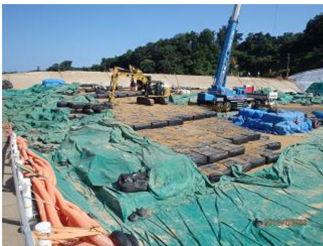
下流側埋立地の埋立状況の確認