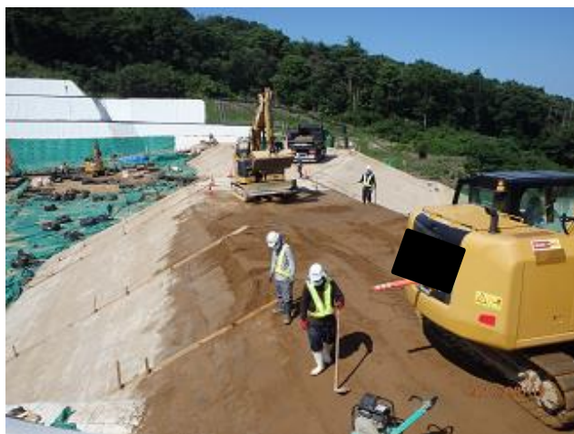
土堰堤の築堤状況の確認