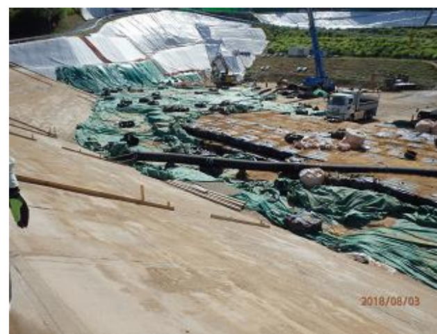
下流側埋立地の埋立状況の確認