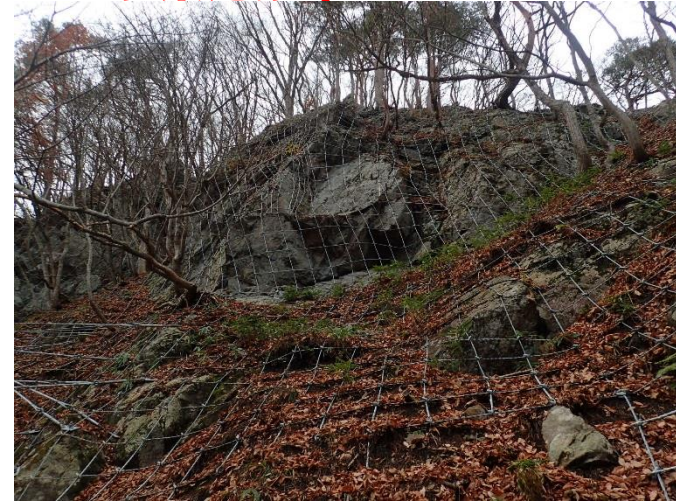
下郷町小沼崎地内

平成30年度も引き続き、落石を抑えるためのロープネット工等の整備を進めてまいります。