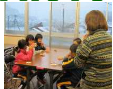
【うがい手洗い後におやつ】