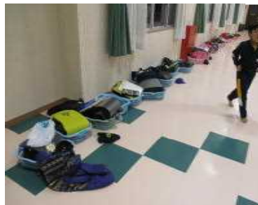
【かごに荷物を入れます】