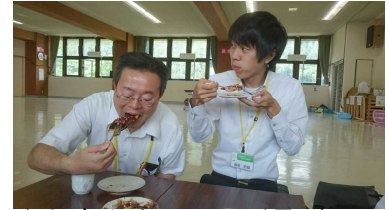
↑お腹をすかせた所員が…