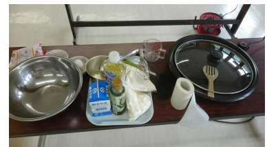
↑きれいに整えられています

できあがったホットケーキは、その後みんなで食したわけですが、自分たちが作ったホットケーキはさぞかしおいしかったことでしょう。我々もお裾分けいただきました。とってもおいしかったです。ありがとうございました。