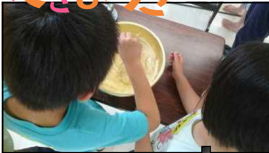
①材料をかき混ぜて…