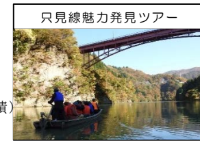
只見線魅力発見ツアー