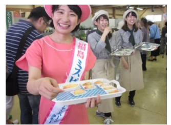
「おいしいふくしまいただきます！」 キャンペーン

◆将来性と成長性が見込めるとともに、地域経済への波及と地域振興への貢献が期待される県内に立地する企業に対し、機械設備等の設置に係る費用を支援しています。