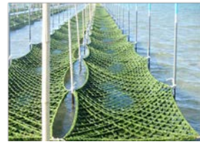
青のり養殖の復活（相馬市）