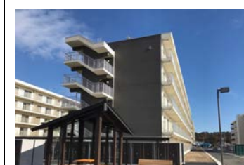
復興公営住宅（南相馬市）