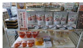
地元産野菜を使った 6 次化商品 (たのせ地区)