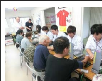
地域医療体験研修事業