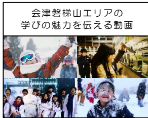
会津磐梯山エリアの学びの魅力伝える動画