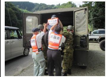
県北地方防災訓練

◆情報連絡員（県リエゾン）を市町村へ派遣し情報伝達訓練を行うとともに、県リエゾンが市町村防災訓練に参加することで情報連絡体制の確立を図っています。