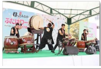
ふたばワールド 2017in とみおか