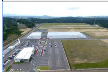
工業の森・新白河B工区