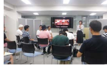
首都圏での移住セミナーの開催