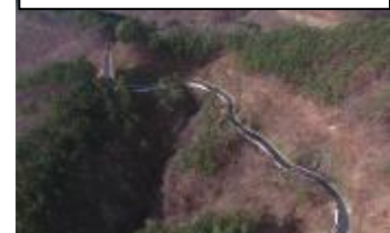
整備中の森林管理道