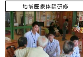
地域医療体験研修