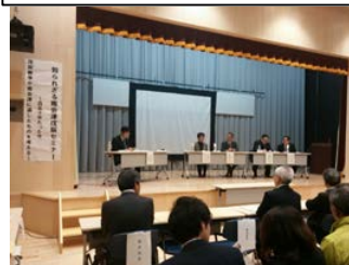
「南会津の戊辰」に焦点を当てた セミナー（只見町）