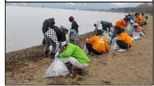
猪苗代湖漂着水草回収