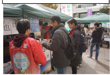
秋の『ふくしま』大収穫祭