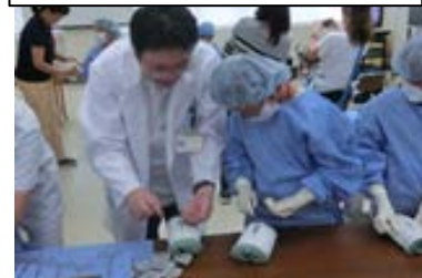
病院での縫合体験