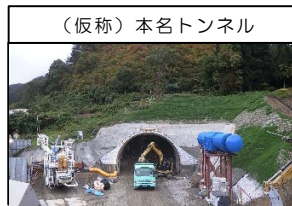
（仮称）本名トンネル