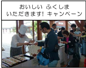
おいしい ふくしま いただきます! キャンペーン