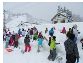
ふるさと教育（明和小）