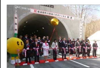
原町川俣線(八木沢トンネル) 平成30年3月18日開通