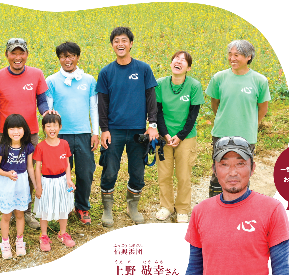
ふっこうはまだん 福興浜団