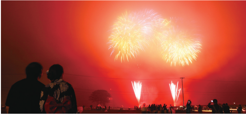
▲ 打ち上げられる花火は約2000発。飲食ブースやライブなども予定。