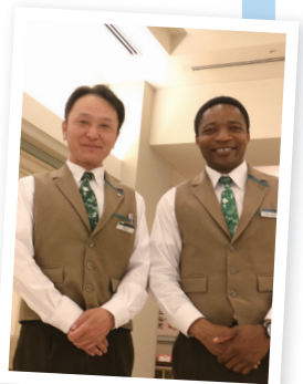
ホテルリステル猪苗代で フロントの仲間と一緒に

野口英世博士の生涯に感動して、博士の古里の猪苗代町に住 んでみたくて来日しました。いつも明るく声をかけてくれる町の人 たちが大好きで、ここは「第二の古里」です。休日に亀ヶ城公園や 猪苗代湖の志田浜を散歩するのがお気に入りですね。町は2020 東京オリンピック・パラリンピックのガーナのホストタウンなので、 ガーナの選手たちをおもてなしして、福島の良さを伝えたいです!