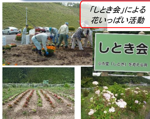
「しとき会」による 花いっぱい活動