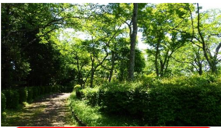
「葉洩れ日」と「木々のざわめき」 と「小鳥のさえずり」