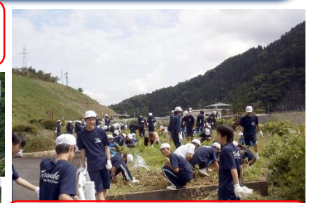
「川部中学校生徒」によるダム周辺 クリーンアップ活動