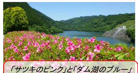
「サツキのピンク」と「ダム湖のブルー」 のコントラスト