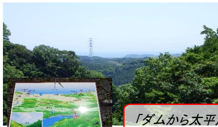
「ダムから太平洋が望めます」