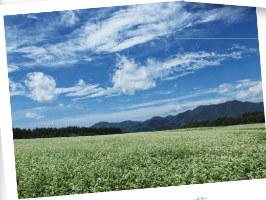
下郷町 さるがく 猿楽台地のそばの花