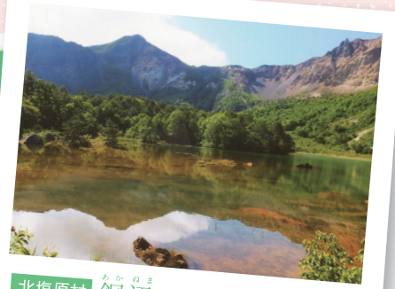
北塩原村 あかろま 銅沼