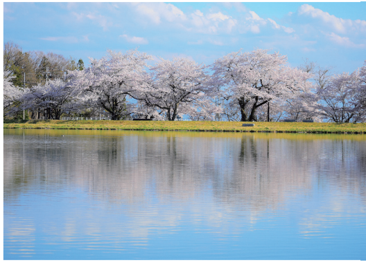
喜多方市 道の駅喜多の郷 八方堤周辺の桜