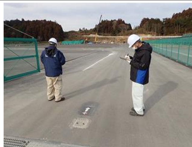
保管場における空間線量率測定場所の確認