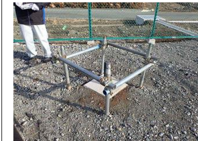
モニタリング井戸の設置状況の確認