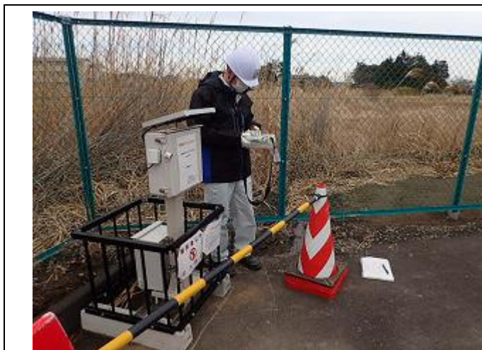
保管場における空間線量率の確認