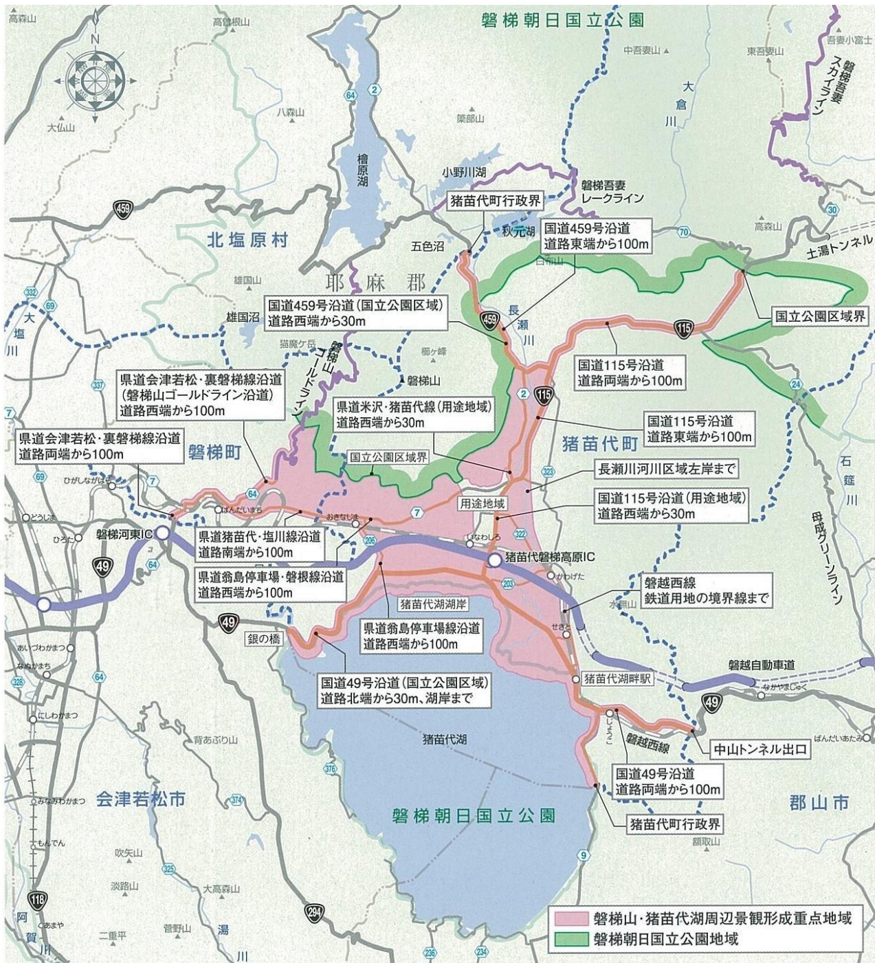
【磐梯山・猪苗代湖周辺地域景観形成重点地域】