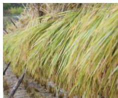
秋にはお待ちかねの稲刈り体験も開催します。