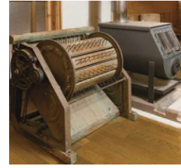
味のある足踏み式の脱穀機もまだまだ現役で活躍中です。