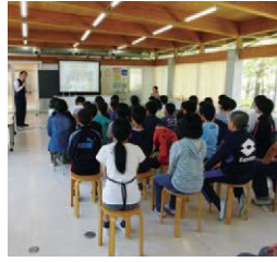
仕事の合間を縫って、日本各地で講演会も行う小川さん。