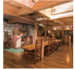
小学校の分校だった校舎は、改修されて心地いい空間に。