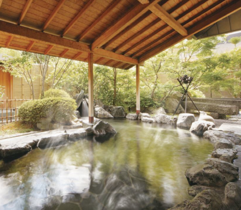
4 四季ごとに美しい庭園を眺めながら浸かれる大露天風呂。手足を思う存分伸ばせば、日頃の疲れも吹き飛んでしまいそうです。