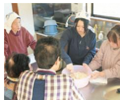
地元のおばあちゃんから教わる甘酒づくり。