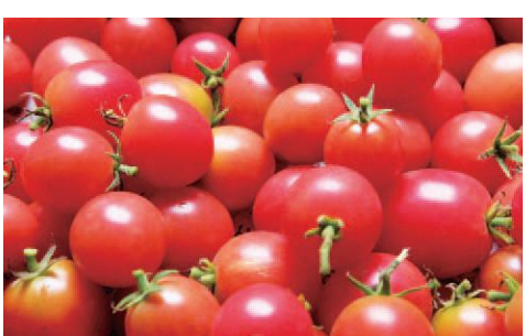
農薬や化学肥料を使っていないので、安全で安心な野菜を収穫できます。