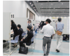
会津の企業が集まる就職フェアに参加します。