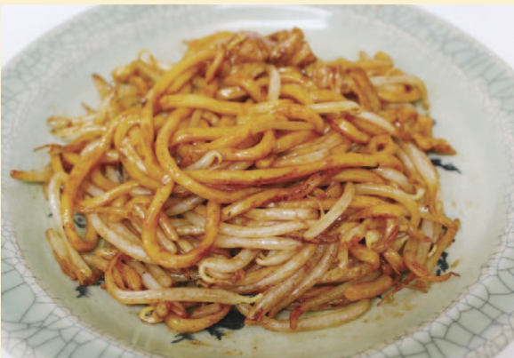
2 通常の約3倍もある太い麺と、濃厚ソースが絶妙な、なみえ焼そば。お土産としても購入できます。

福島県の太平洋に面する浜通りは、一年を通して比較的温かく冬の降雪も少ない地域です。海が見える温泉、新鮮な魚貝類、ご当地グルメなどを楽しむことができます。地域の歴史にも触れながら、のんびり縦断しましょう。