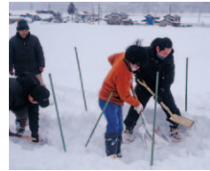
雪国ならではのジョセササイズ(除雪でエクササイズ)。