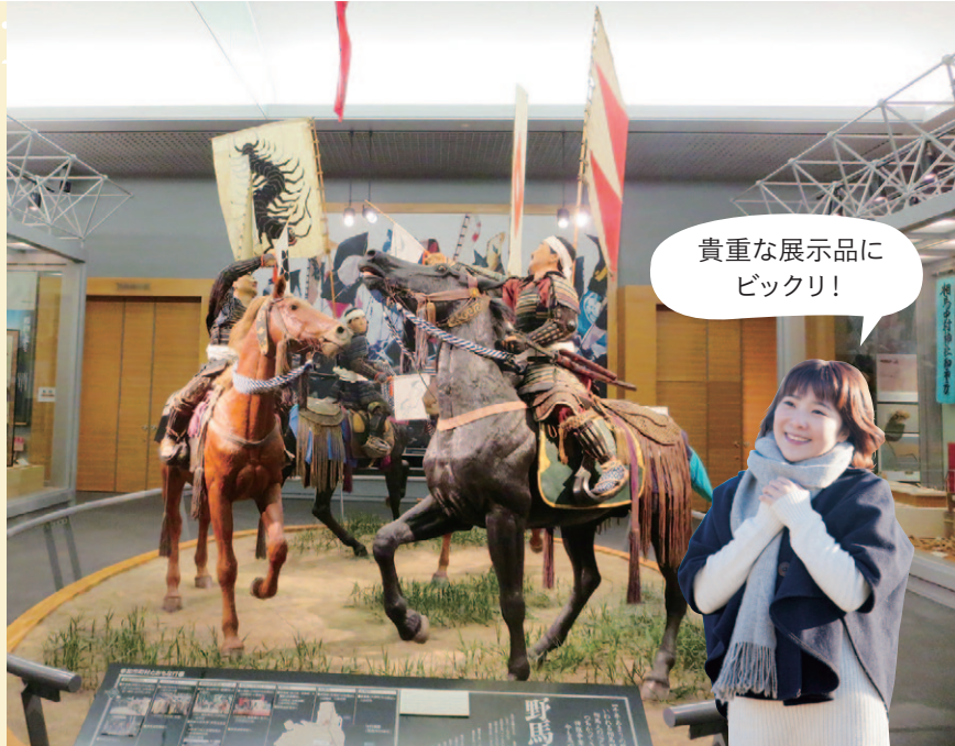
3 国指定重要無形民俗文化財である「相馬野馬追」の歴史や文化にまつわる資料がたくさん!