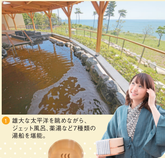
1 雄大な太平洋を眺めながら、ジェット風呂、薬湯など7種類の湯船を堪能。