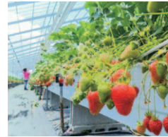
採れたてのいちごを味わえるいちご狩り体験。