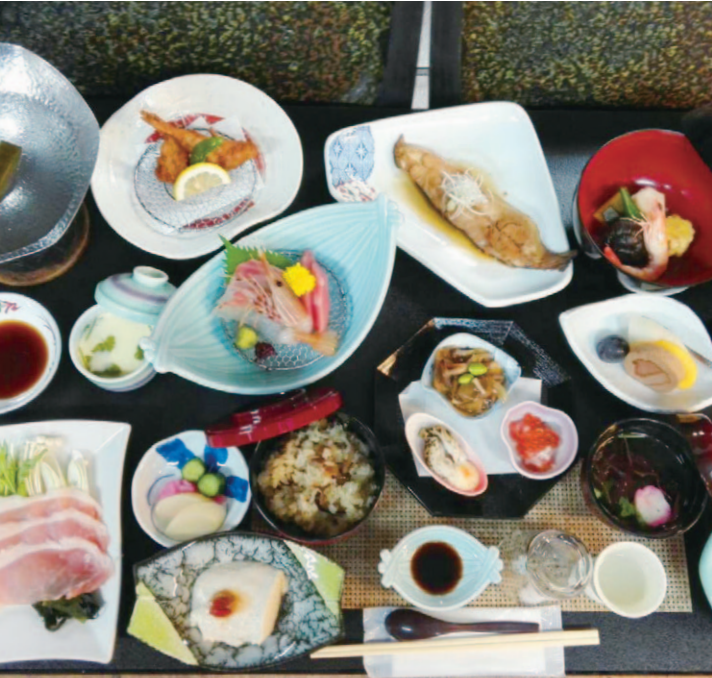
4 海の幸を豊富に使ったコース料理。新鮮な海産物を存分に味わって。