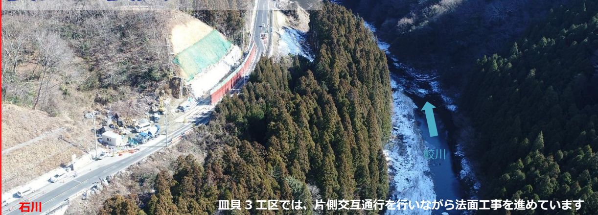
石川 皿貝3工区では、片側交互通行を行いながら法面工事を進めています

いわき市と中通りを結ぶ地域連携道路を工事中「道路課」 — 道路の機能を「高め」ます —