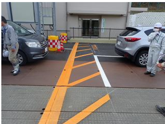
管理区域の設定状況の確認