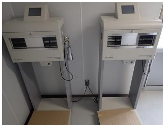
管理区域退出時汚染検査場所の確認