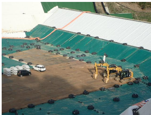
下流側埋立地のシート等設置状況の確認