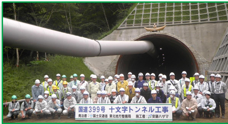
参加者のみなさん(約60名)