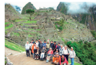
憧れの空中都市マチュピチュ遺跡 ペルー感動紀行

バリアフリーツアーというと、障がい者向けのツアーというイメージが強いですが、利用者の9割以上は車イスや杖を利用する高齢者です。