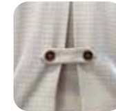
背中プリーツ加工