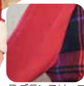
ラグランスリーブ