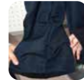
裾まわりのホック