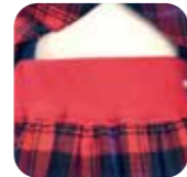
ウエストのゴム加工