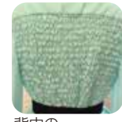
背中シャーリング加工