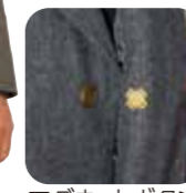
マグネットボタン