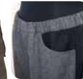
ウエストのゴム加工