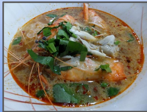
トムヤムクン(タイ)