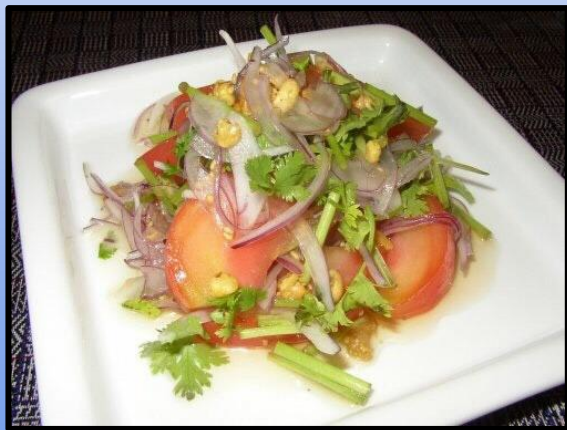
トマトサラダ(ミャンマー)