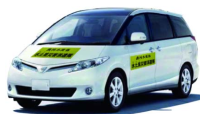
車両用ステッカーのイメージ