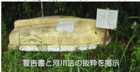
警告書と河川法の抜粋を掲示

河川は、洪水時等に多くの水を安全に下流に流す必要があります。放置船は河川水の流水の妨げとなること、大雨で河川の水位が上がった際に流出し、ダム施設へ損傷を与えることなどが危惧されるため、速やかに撤去することが求められます。