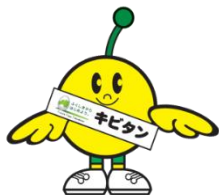
福島県復興シンボルキャラクター 「ふくしまから はじめよう。キビタン」