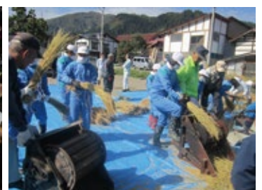
三島小総合学習 田んぼの学校 脱糞