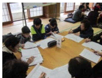
三島小総合学習 おばあちゃんの味打ち合わせ