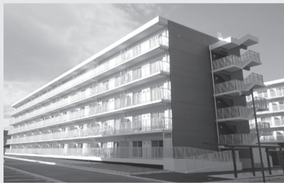
▲南相馬市「南町団地」

建築住宅課(復興住宅担当)のホームページ内「復興公営住宅 動画による完成住宅の紹介」より見たい動画を選んでご覧ください。