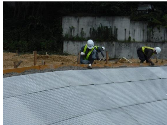
法面の防草マット布設工事