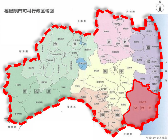
福島県市町村行政区域図