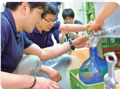
醸造酒の製造作業に取り組むアカデミー生