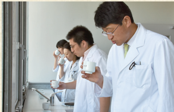
「きき酒」をして色、香り、味などを確認する様子

自分のノウハウを「吟醸マニュアル」としてまとめました。それをもとに若い杜氏さんが醸造した日本酒の評判が良くて、マニュアルが県内に広まったんです。その後、平成18年に全国新酒鑑評会で福島県が金賞受賞数日本一になり、今も私のマニュアルが県内の酒造りに生かされていることはとてもうれしです。 県清酒アカデミーでは地元杜氏の育成に力を入れており、若い力も着実に育っている「福島の酒」、これからがとても楽しみです。