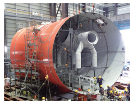
樹業遠隔技術開発センター

浜通り地域の産業振興を図るため、ロボットのテスト施設などを整備するほか、地元企業による実用化開発の補助などを行います。