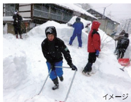
イメージ 高齢者を助ける雪かたしボランティア

都市部に住む若者を受け入れる「地域おこし協力隊」の受入体制を整備することで、定住人口の増加を図ります。