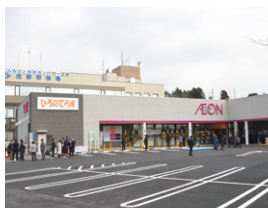
3月5日にオープンした「ひろのてらす」(広野町)

避難地域12市町村が計画している復興拠点づくりを支援します。また、商業機能を確認し、皆さんの帰還を支援します。