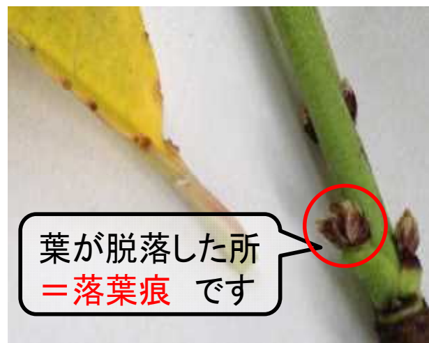
(越冬する菌が侵入する部位)