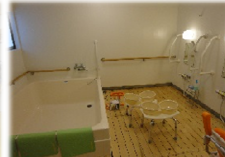
高齢者サポート施設のイメージ