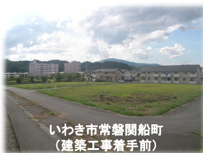
いわき市常磐関船町 (建築工事着手前)