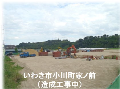
いわき市小川町家ノ前 (造成工事中)