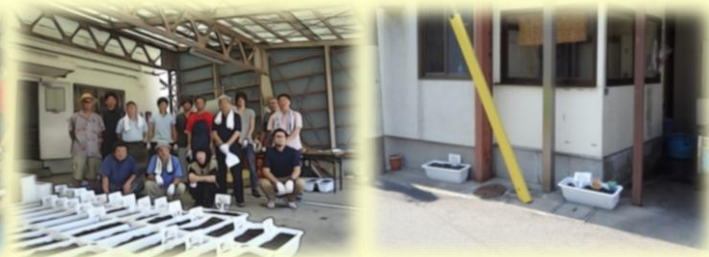
【プランターづくり・配布（7.11実施）】