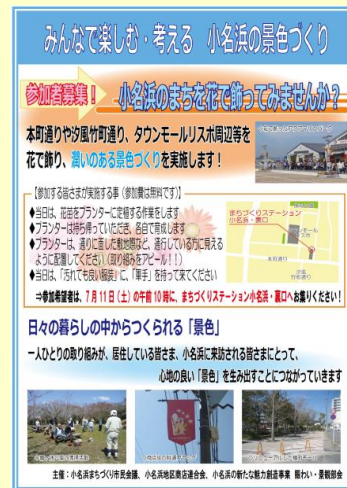
【参加者募集のチラシ】