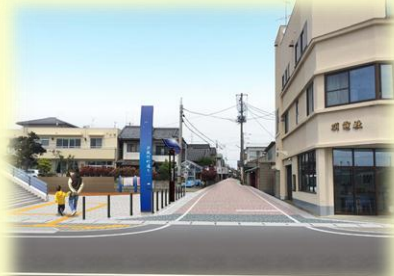
【小名浜港線側の汐風竹町通り（イメージ）】