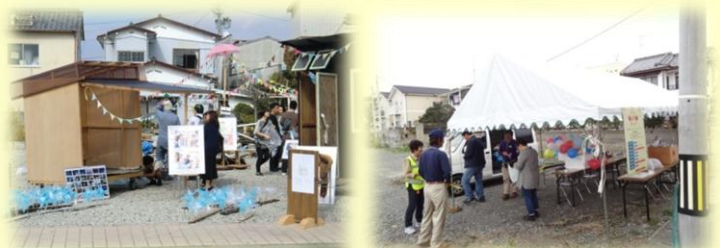
【オープンスペースでの活動イメージ】