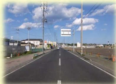
【現在の小名浜港線】