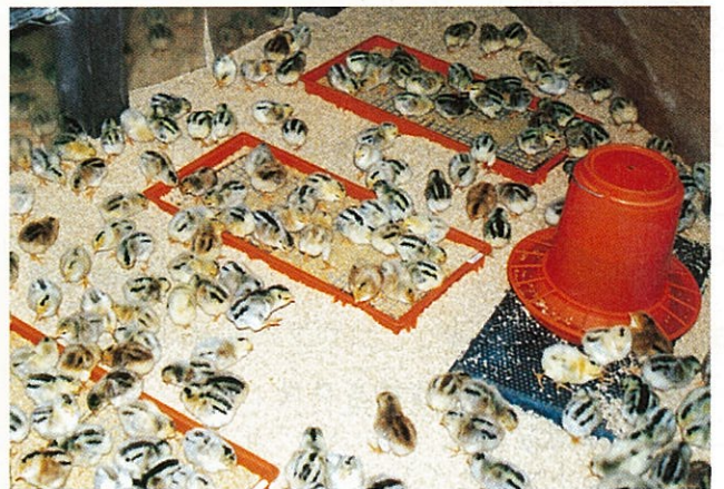
元気に餌をついばむ会津地鶏のヒナ

最後になりますが、これからも愛情を一杯に受けて会津地鶏のヒナは、すくすくと育って行くことでしょう。 (農業振興部)