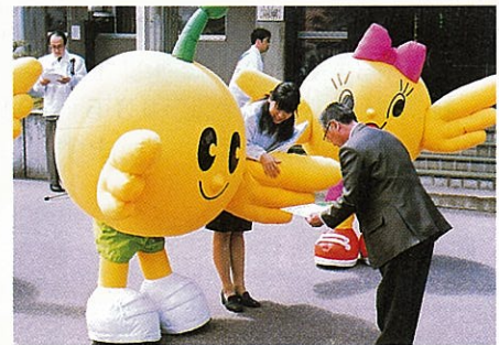
キビタンから前売り券が渡されました

第1期前売り入場券（今年末まで）は、大人2,500円、高校生1,500円、小中学校生1,100円です。お求めは、各町村のうつくしま未来博推進協議会（事務局は町村役場内）などで。