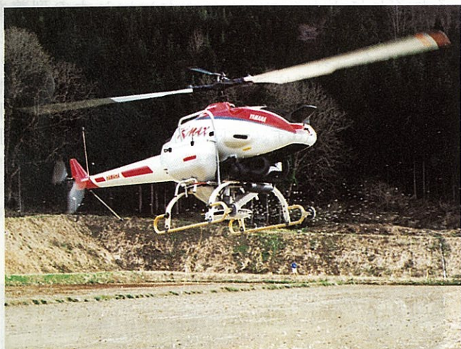
昨年の無人ヘリ直播の様子(伊南村)