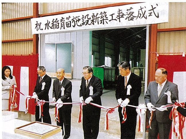
落成を祝ってテープカット

こうした状況の中、120ha処理可能な育苗施設と農業機械やライスセンター等既存施設との有効利用を図ることで省力化・低コスト化による生産性の高い稲作生産体制による安定的・効率的な稲作生産システムが確立され、今後の水田農業の発展に大きく貢献していくことになります。(農業振興部)