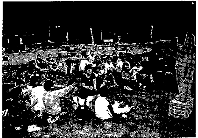
ふれあい広場（伊南村）

また、平成9年度から継続事業で、大桃地区・平沢に3.08ha程のオートキャンプサイト、サンタリーハウス、炊事棟、管理棟などを設けた本格的オートキャンプ場で、森と水に親しみ思いっきり自然を満喫できる空間として平成12年春にオープン予定です。周辺の小豆温泉、花木の宿、高畑スキー場とともに、温泉と自然の融和した一大リゾートゾーンとして大いに利用されることを期待しております。