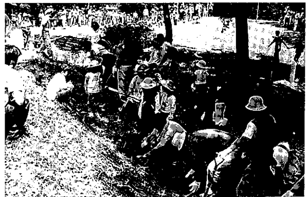
親子で記念植樹を行う

6月6日、南郷村大字界の高清水公園において、「親子緑の教室」を開催しました。この教室は、親子で自然と親しみながら緑や森林の大切さを学ぶことを目的に緑化募金等を利用して毎年行っており、今回で13回を数えます。今回は郡内から98家族278名が参加し、林内を散策しながら森林の持つ諸機能や自然の仕組みを学習したり、レンゲツツジを記念植樹したほか、木製のすのこ制作を実施しました。