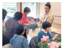
「いろどりフラワーコース」

●申込方法:往復ハガキに①氏名②住所③電話番号④職業⑤受講希望コース名を記入の上、県農業総合センター企画技術科までお申し込みください。詳細はホームページでご確認ください。