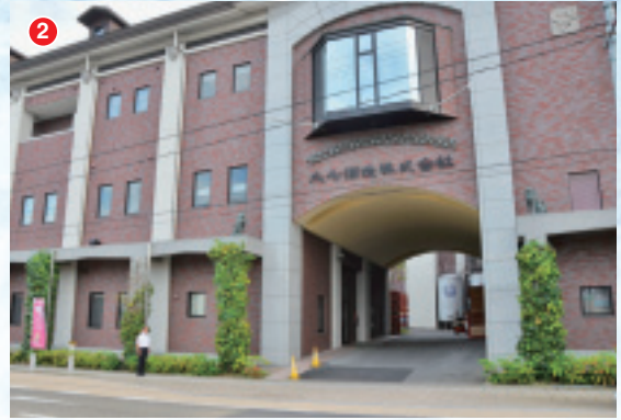
② 大七酒造(株) 代表銘柄：箕輪門 純米生酏 全国唯一の生酏造りと独自の超扁平精米技術で世界に躍進します。 二本松市竹田 1-66 TEL0243-23-0007