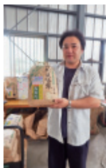
8月下旬に出荷された早場米「五百川」