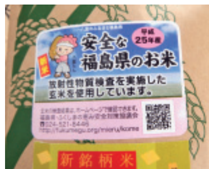
検査を受けた米を使用した精米袋に貼られるラベル