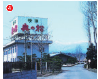
④ 奥の松酒造(株) 代表銘柄：純米大吟醸 大自然の豊かな恵みと卓越していた 技が酒造りの新しい歴史を刻む。 二本松市長命 69 TEL0243-22-2153