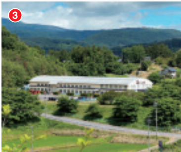
③ 人気酒造(株) 代表銘柄：人気一大吟醸 吟醸しか造らない蔵。 手づくりでしか造らない蔵。 二本松市山田 470 TEL0243-23-2091