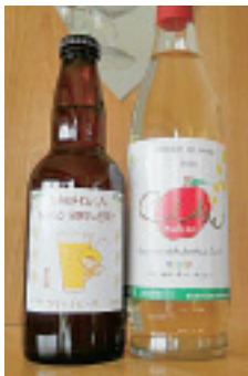
問：福島農家の夢 ワイン株式会社 二本松市木幡字白石 181-1 TEL0243-24-8170