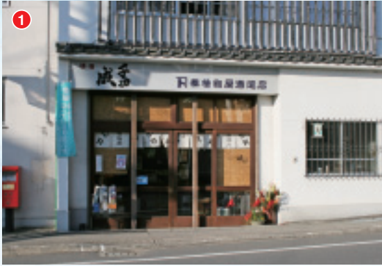
① 株式会社樽物屋酒造 代表銘柄：千功成 ほとんどが地元で飲まれる、地酒の中の地酒です。 二本松市松岡 173 TEL0243-23-0164