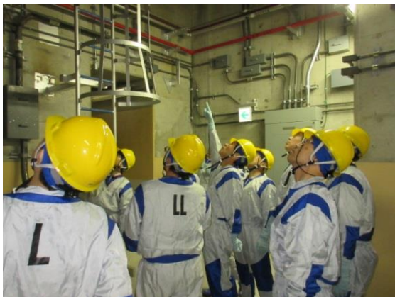
水が漏えいしたダクトを確認する様子