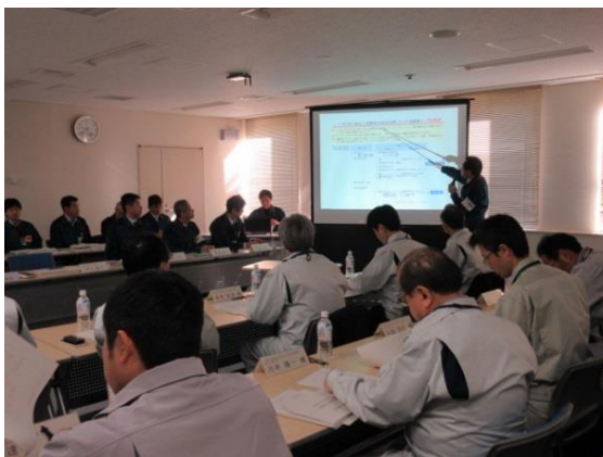
地震の対応状況について 東京電力担当者から説明を受ける様子