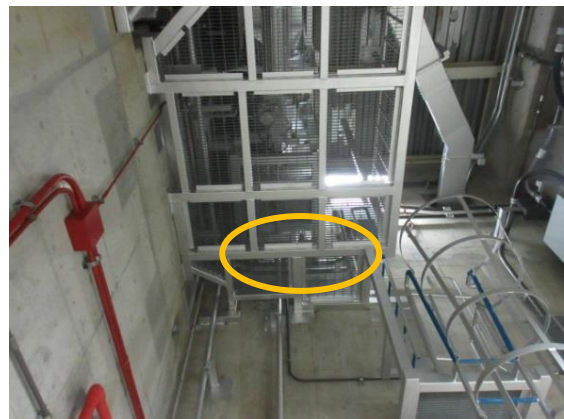
ダクトの漏えい部