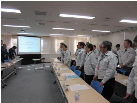
廃炉安全監視協議会の開催にあたり 危機管理部長から挨拶する様子