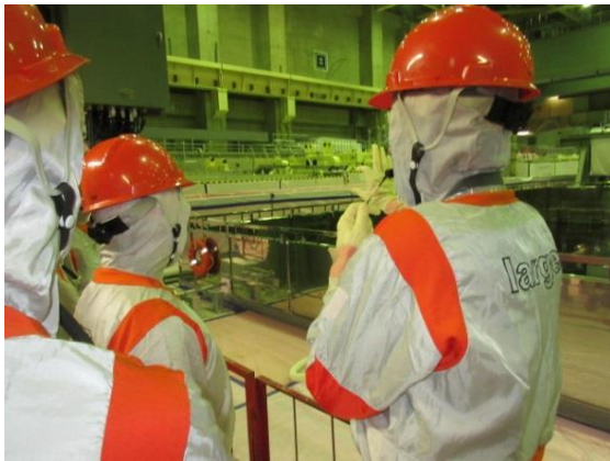
東京電力担当者から地震発生時の状況について説明を受ける様子