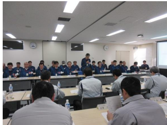
廃炉安全監視協議会の開催にあたり 福島第二原子力発電所長から挨拶する様子