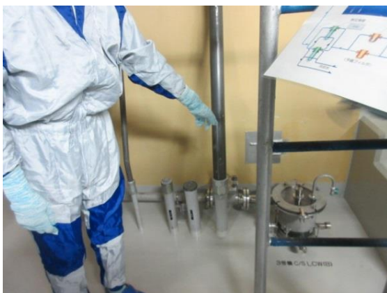
漏えいした水により水溜まりが出来た箇所