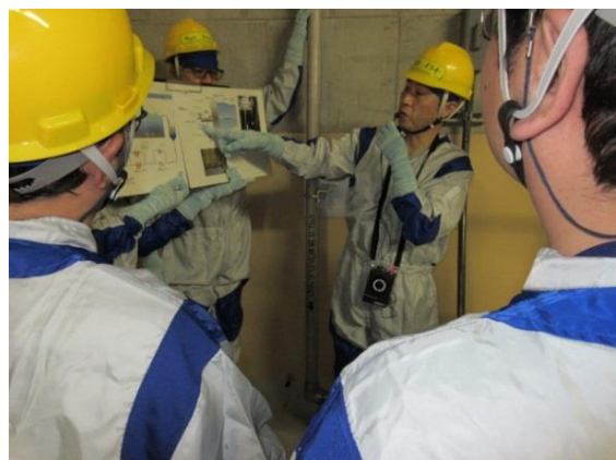
漏えいについて東京電力担当者から説明を受ける様子