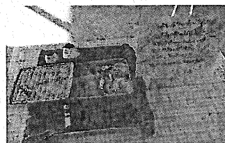
【中学校の部】最優秀「はじまりのあいづ弁当」