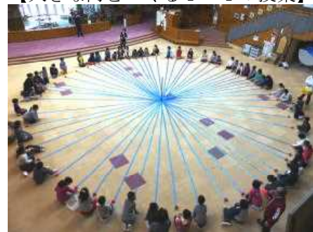
<円の概念や美しさを体感した>