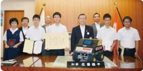
家族の安全を守る多機能型ホームセキュリティロボット「Pro ROBO」