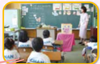
〈会津若松市立城南小学校〉

また、「ふくしまっ子ごはんコンテスト」を実施し、小・中学生が朝食や弁当の献立を考え、調理することにより、 食べる力 を育てています。